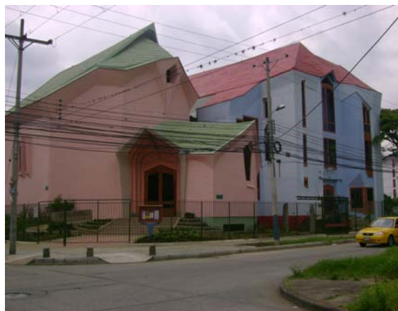
Imponente fachada de la Iglesia

Al otro lado, el elenco tenía sus propias preocupaciones: las canciones, los textos, las telas y confecciones de los