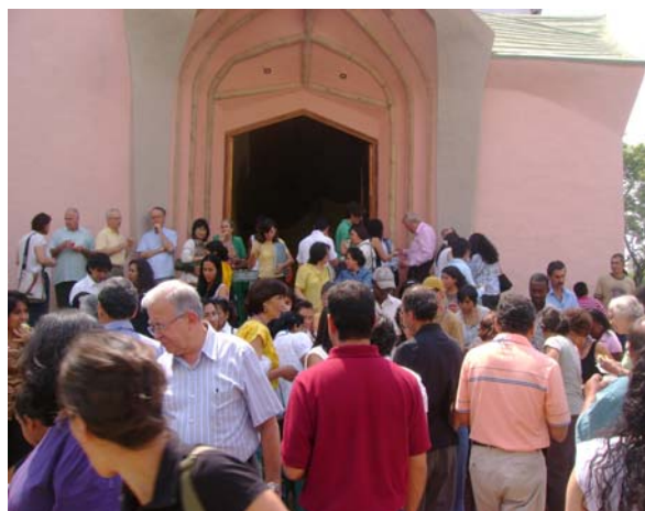
Compartiendo merienda en la plazoleta