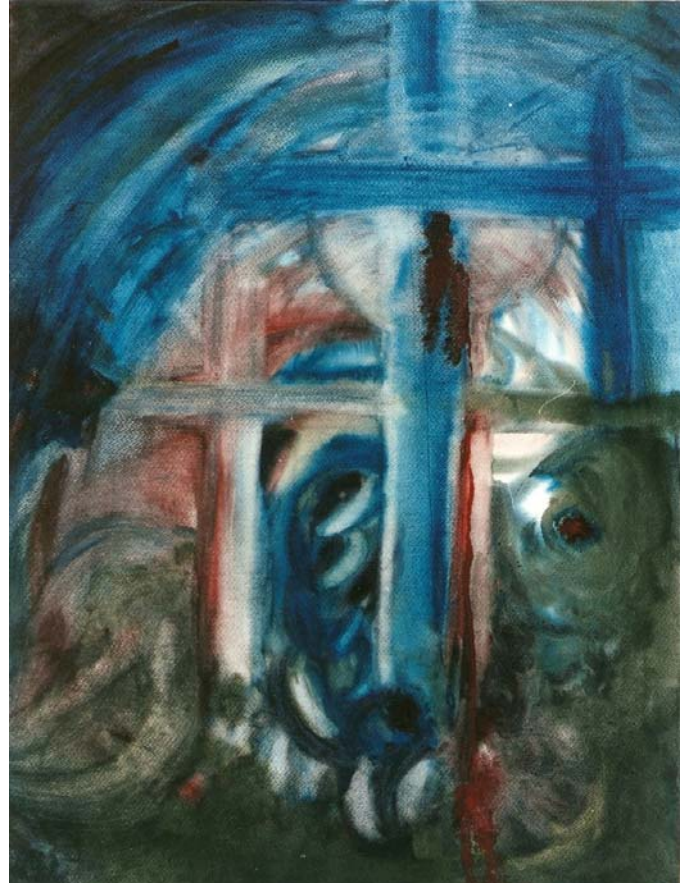
Viernes Santo Negro

Un significado de "sacrificar" es: "abrir todo nuestro ser a la vida divina". Esto tiene su consecuencia en nuestra vida cotidiana. Si tratamos de realizarlo realmente, pasaremos necesariamente por el sacrificio y quizás vivenciar sufrimiento. "Todo nuestro ser"... se refiere no solamente a nuestro cuerpo físico, sino también al pensar, sentir y a nuestra voluntad; las tres fuerzas principales del alma en donde actúa nuestro Yo. Podemos abrir "nuestro ser" cada vez más en la manera en que nos damos cuenta que todo lo que somos surgió y surge