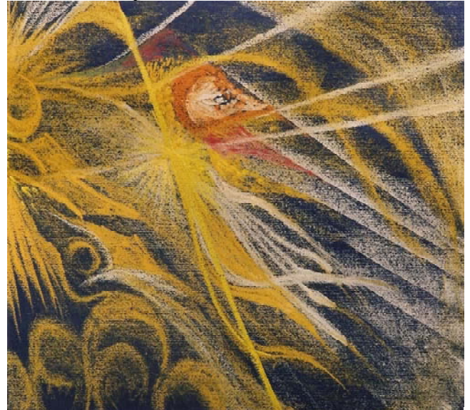
trabajo individual - técnica tizas sobre cartulina azul

JUAN el BAUTISTA Blanco y Amarillo Desde el 24 de junio - 4 Semanas