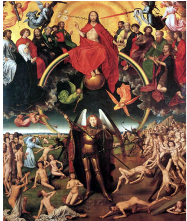
Autor: Hans Memling, El Juicio Final

Cuando empezamos la época de Micael en el penúltimo día de Setiembre nos encontramos parados sobre hielo delgado. No porque esta época sea algo dudosa y no porque su contenido o su fecha permitieran alguna incertidumbre- sino porque el Arcángel mismo nos prepara en este día el "hielo delgado"